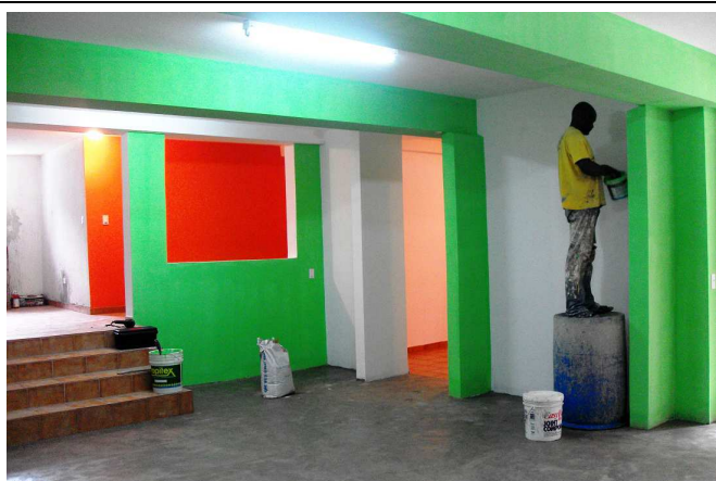
Sous-sol : la couleur ne manque pas