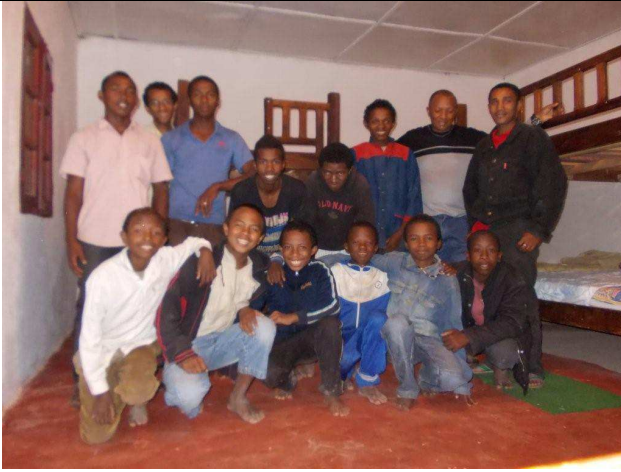
Accueil au gîte de nuit

Merci à tous ceux qui nous ont permis la réouverture de cette maison d'accueil. Merci à ceux qui y apportent leur aide et à ceux également qui vont commencer.