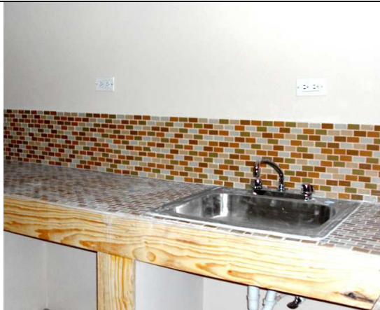
Les machines vont arriver