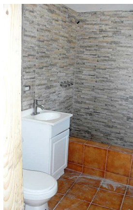
Tout est prévu