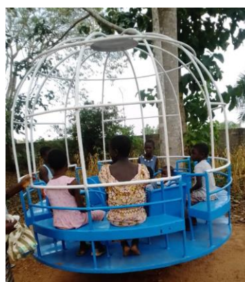
Aire de jeu, Tohoun

« La récolte de notre champ de manioc. On va faire les couscous pour manger avec le mpem ( feuille de manioc, arachide, poisson fumé). Très bon »