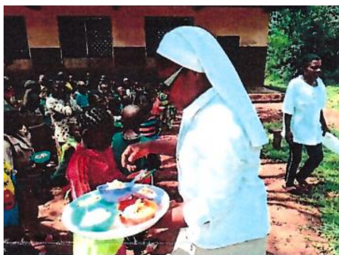
Partage de repas par la Sœur Responsable