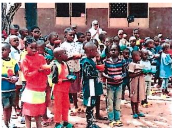
Chaque enfant possède son repas